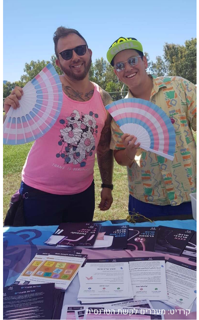
קרדיט: מעברים לקשת הטרוסקסית

ע"פ מחקר המכון הישראלי לחקר מגדר ולהט"ב משנת 2019, 80% מהלהט"ב בחברה הערבית נחשפו ללהט"ב בפופייה בבתי הספר, בשכונה בה גדלו ובמשפחה. כ-60% דיווחו על להט"ב בפופייה המופנית אישית אליהם במרחבים אלו. 80% חיים בארון לגמרי או חלקית.